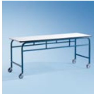
Abb. zeigt MB 03