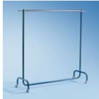
Abb. zeigt MTR 2 (F)